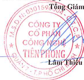
Lâm Thiệu Quân