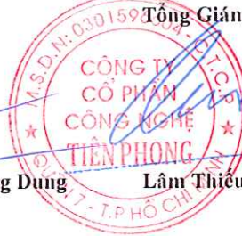
Lâm Thiệu Quân